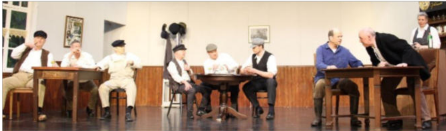
Eine Szene aus „De Vergantschoster“ im Frühjahr 2025.

Mit Stolz und Freude hat der Vorstand anlässlich des 100-jährigen Bestehens der Niederdeutschen Bühne Norden zahlreiche Aktivitäten ausgerichtet. Sie starteten mit dem Erstellen einer Chronik über die Geschichte der Bühne sowie mit Berichten und Anzeigen-Sonderseiten im Ostfriesischen Kurier, der Heimatzeitung in Norden, die den Verein von Anfang an immer wohlwollend begleitet hat. Auch elektronische Medien, wie der NDR, Radio Nordseewelle oder das NDR-Fernsehen berichteten über das Jubiläum und die Arbeit der Bühne.