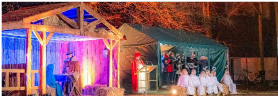
Das „Lebennig Krippenspiel“ war wieder ein Publikumsmagnet.